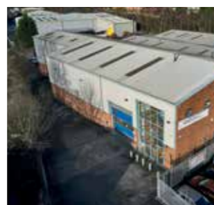
Maceplast U.K. LTD United Kingdom