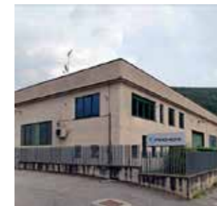
Pagnoni s.r.l. Italy