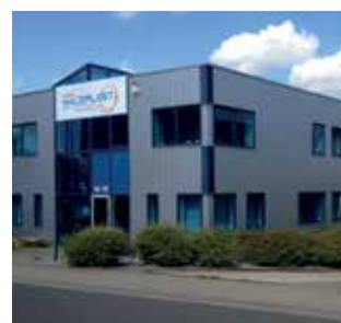
Maceplast GmbH Germany

Guarniflon Spa accepts no responsibility for the completeness or accuracy of the information given. The layout, texts, images and graphics on this catalogue are protected by law. This notably applies with regard to brand and patent rights, but also to all other forms of intellectual property rights. The reproduction or dissemination of individual catalogue contents, in whole or in part, and/or entire catalogue is prohibited.