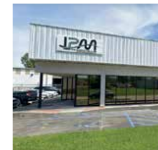
Industrial Plastics & Machine Inc. U.S.A.