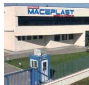
Maceplast Romania S.A. Romania