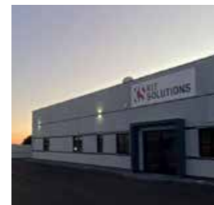
Kit Solutions s.r.l. Italy