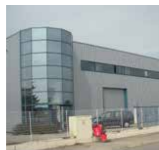
Maceplast S.A. France