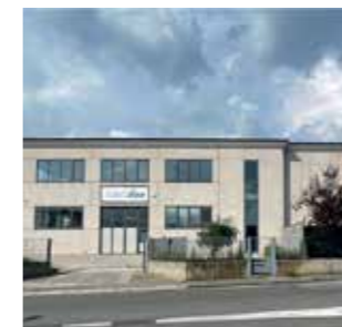
Nextflon s.r.l. Italy