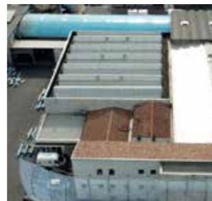
PATI Division Italy