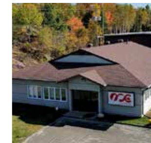
Industrial Plastics Inc. Canada