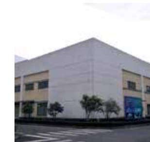
Zhejiang Green Guarniflon Film Technology CO., LTD. China