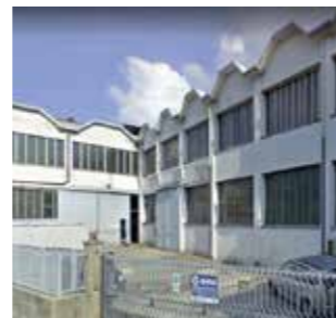
Ghivi s.r.l. Italy