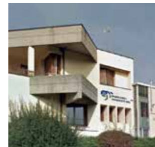
Ghirlandi Maurizio s.r.l. Italy