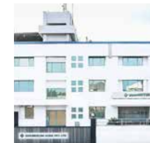
Guarniflon India PVT. LTD. India