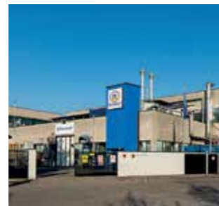
Flontech Division Italy